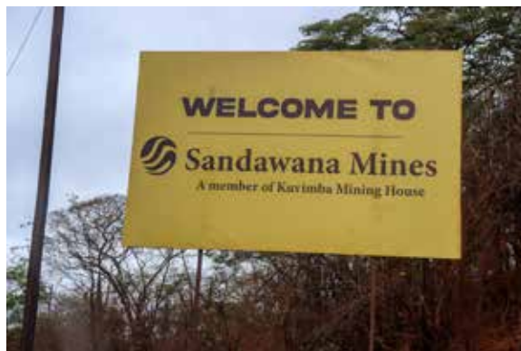
Ehemalige Edelsteinmine im Süden Simbabwes, die zum Schauplatz von Konflikten um den Lithiumabbau wurde

Im Jahr 2022 verhängte die Regierung ein Verbot für den Export von unverarbeitetem Lithium, um die lokale Verarbeitung zu fördern. Das Verbot wurde jedoch wegen seiner selektiven Anwendung kritisiert. Seit 2023 führt ein Forschungsprojekt unter der Leitung des „Tropical Africa Land and Natural Resources Research Institute of Zimbabwe“ Interviews mit Kleinbergleuten in Mberengwa durch, dem Bezirk, in dem sich die Sandawana-Mine befindet. Bislang unveröffentlichte Daten aus diesem Projekt deuten darauf hin, dass die politische Elite das gesetzliche Exportverbot für Lithium genutzt hat, um normale Zimbabwer daran zu hindern, an der Lithium-Wertschöpfungskette teilzuhaben. Sowohl in dieser Studie als auch in den Mainstream-Medien haben Einheimische ihre Vermutung geäußert, dass chinesische Bergbauunternehmen Politikern und Regierungsbeamten Bestechungsgelder gezahlt haben, um trotz des